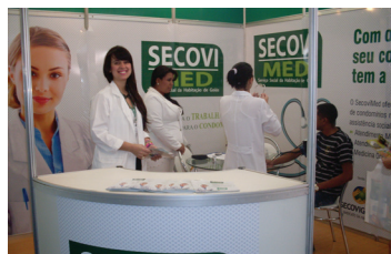
Campanha preventiva SecoviMed no Feirão do Imóvel SecoviGoiás

O AGENDAMENTO PARA O ATENDIMENTO NO SECOVIMED DEVERÁ SER FEITO ATRAVÉS DO TEL: 3239.0810 / 0821 OU PESSOALMENTE NO BALCÃO