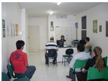
Recepção SecoviMed: agilidade no atendimento

Buscando ampliar sempre a qualidade no atendimento e a comunicação com o associado, o SecoviMed comemora o seu primeiro aniversário presenteando os usuários com um site moderno, funcional, informativo e com ótima usabilidade. No endereço www.secovimedgo.com.br o internauta encontra notícias sobre campanhas preventivas, dicas de saúde, relação de benefícios, estatísticas, entre outras valiosas informações sobre os serviços prestados pelo SecoviMed.